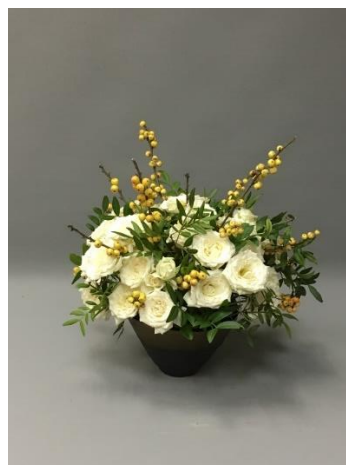
Рисунок 3. Композиция с использованием веток илекса (работа и фотография автора).

Илекс или как Падуб остролистный ( Ilex aquifolium ). Используют во флористике его плоды, которые ярко окрашены в красный, желтый или оранжевый цвета. Плоды расположены плотно к стеблю. В композициях используют падуб как с листьями, так и без них. Это растение отлично подходит как для осенних и зимних композиций. Отлично сочетается со всеми видами растений, придает букету контрастность по текстуре и форме.