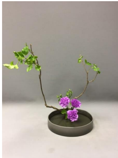
Рисунок 2. Композиция с использованием веток сирени (работа и фотография автора).

Сирень обыкновенная ( Syringa vulgaris ) часто используют во флористике. Для весенних и летних композиций используют почти все виды и сорта этого растения. Они отлично смотрятся как дополнение к другим цветам, так и в монобукетах. Сирень имеет большой спектр окраски соцветий, который позволяет составлять композиции растягивая цвет, от самого светлого до темного. Растение подходит для украшения праздничных мероприятий, поскольку наполняет помещение приятным ароматом.