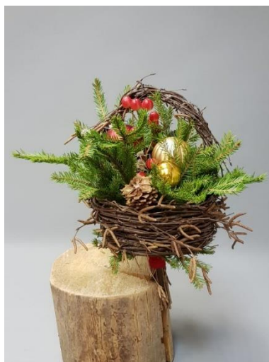
Рисунок 1. Использование веток березы в новогодних композициях.

Береза повислая ( Betula pendula ). Одним из декоративных признаков березы являются молодые, свисающие ветви. Используя их в букете, можно добиться легкости и непринужденности. При составлении флористических композиций ветки можно легко согнуть, скрутить или сплести вместе. Березу используют для сезонных весенне-летних букетов. Окрашенные в различные цвета ветки растения увеличивают вариативность их использования. Например, если взять ветки, окрашенные в белый цвет, то их можно использовать в зимних букетах. Они будут гармонично смотреться и напоминать покрытые снегом или инеем веточки.