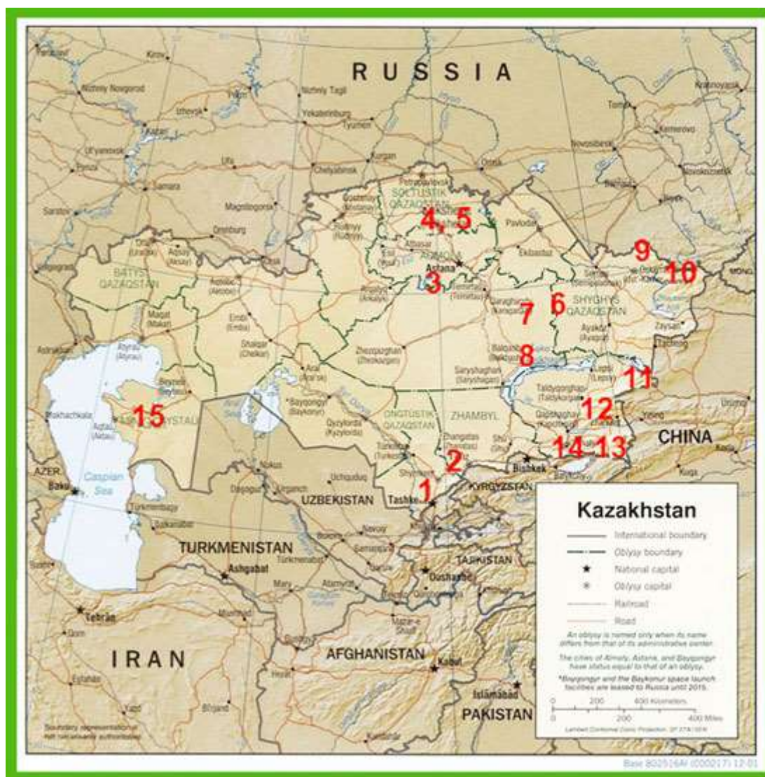
Рис. 2. Расположение экосайтов, созданных на территории Республики Казахстан.

Однако при детальном рассмотрении данной платформы и некоторых казахстанских проектов по созданию и продвижению экосайтов было выявлено, что наиболее главной их проблемой является отсутствие сильной маркетинговой стратегии продвижения турпродуктов в ту или иную природную территорию, на базе которой создан экосайт.