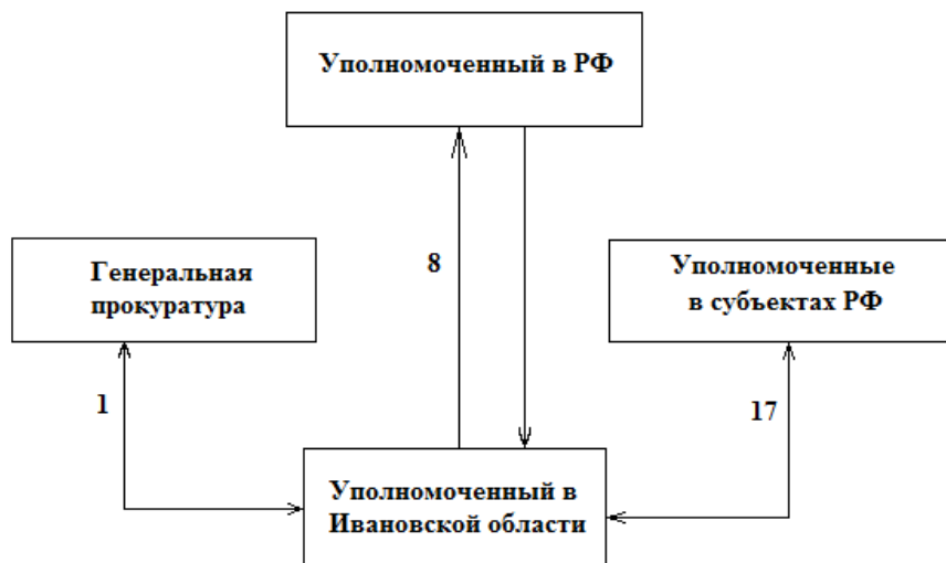
Рис. 1. Граф из множества объектов, в котором Уполномоченному по правам человека в Российской Федерации отправлено 8 из 692 запросов по обращениям

Автор данной статьи надеется, что теория графов будет способствовать раскрытию потенциала института Уполномоченных по правам человека в Российской Федерации.