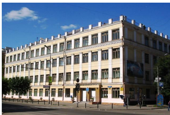
Рис. 2. Школа №10, в которой в годы Великой Отечественной войны был расположен эвакуационный госпиталь №1515. Здесь жил и лечил В.Ф. Войно-Ясенецкий

Проблемы обманутых дольщиков, переселение из ветхого и аварийного жилья, жилищно-коммунальный комплекс - данные задачи [3] находятся на постоянном контроле как у специалистов Аппарата Уполномоченного по правам человека в Российской Федерации, так у региональных Уполномоченных.