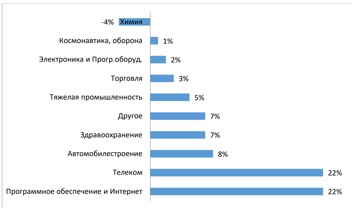
Рис.3 – Динамика изменения инвестирования в инновации с 2014 по 2018 гг. [5]

Итак, в соответствии со статистическими данными, опубликованными на сайте Росстата, можно сделать вывод, что за последние 5 лет увеличилось число инвестиционных средств в разработку и внедрение инноваций в сфере программного обеспечения (22%) и телекома (22%). Необходимо отметить, что значительный спад наблюдается в сфере химии, где за последние 5 лет показатель снизился на 4%.