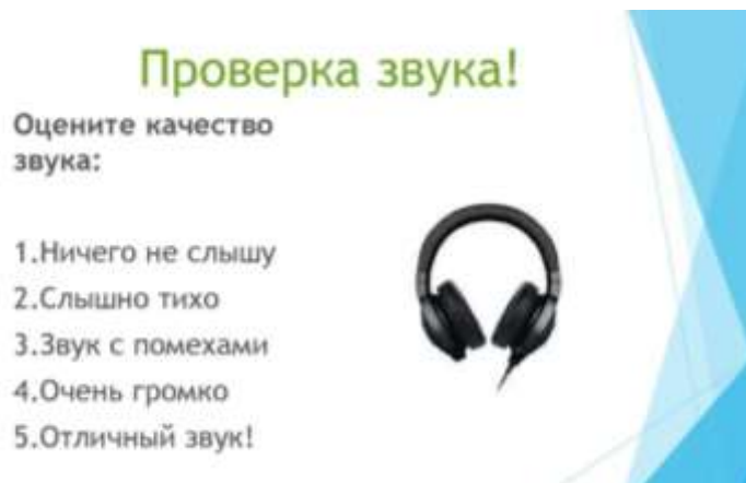
Рис.1. Проверка звука

На организационном этапе урока необходимо провести проверку звука, для этого удобно использовать заранее подготовленный слайд (рис.1)