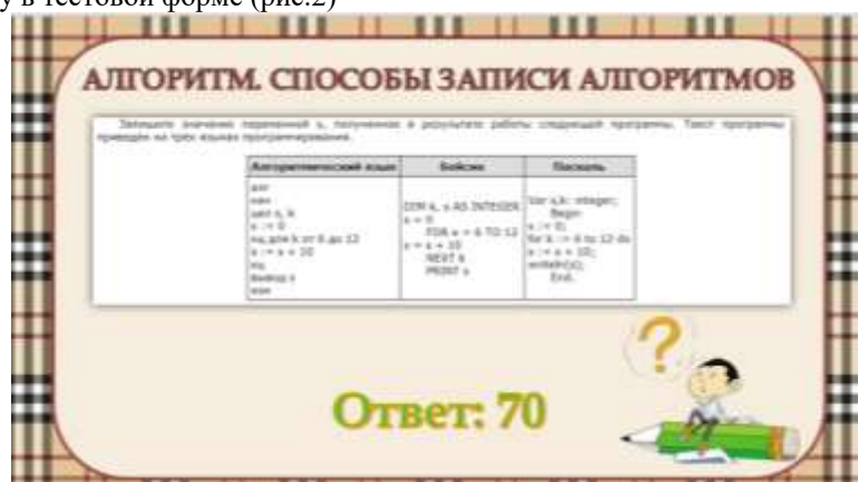
Рис.2. Примеры заданий

На этапе повторения можно использовать различные форматы проведения опроса, например, можно организовать проверку в тестовой форме (рис.2)