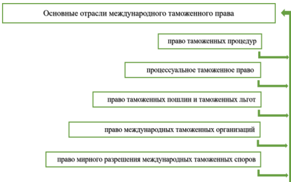
Рисунок 2 - Основные отрасли международного таможенного права

Подотрасли (отрасли) международного таможенного права сформируются путем юридического оформления наиболее важных областей регулирования в рамках совершенствования таможенной деятельности. Разновидности подотраслей международного таможенного права схематично отражены на рис. 2 [1, с.15].