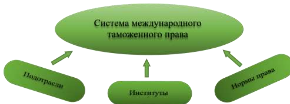
Рисунок 1 - Системообразующие элементы международного таможенного права

Придерживаясь данной логики исследования, в доказательство системности международного таможенного права, рассмотрим внутреннее строение МТП, как отрасли (подсистемы) международного публичного права. Для чего, согласно общей теории права, установим наличие у него таких основных системообразующих элементов, как нормы права, правовые институты отрасли и подотрасли (отрасли) МТП (рис. 1).